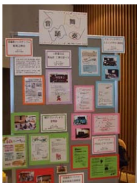
6図書館のイベントを紹介しました。