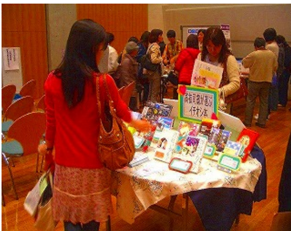
高校図書館フェスティバルで選ばれたもの。