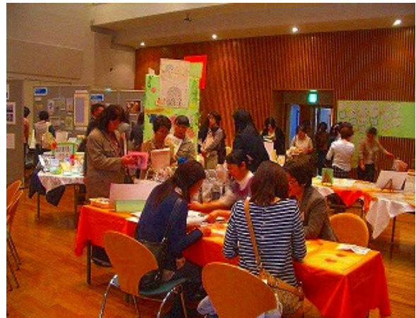
材料を用意してしおりを手作りしてもらった。