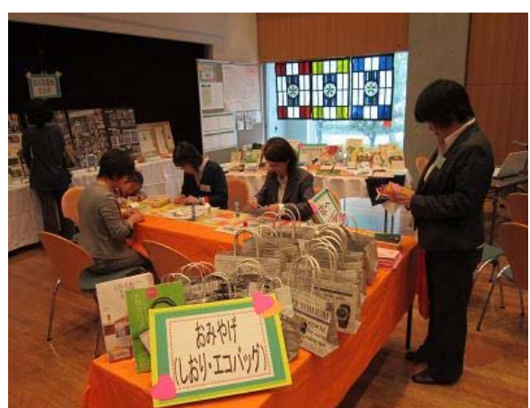
後ろは生徒が作ったステンドグラス。