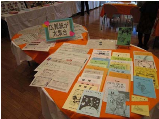
各校の新作図書案内や図書館だよりを並べた。