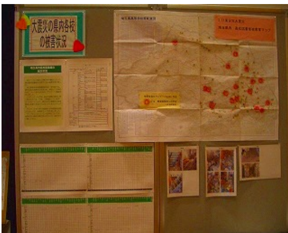
高校図書館でも本が落ちたり書架が倒れたり。