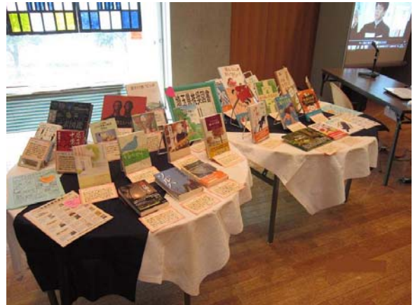
手書きのPOPをつけて展示した。