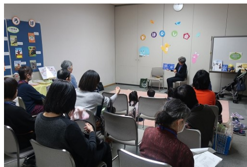
ぜんかいかいじょうかいさい かい ようす 前回会場開催(2019)のおはなし会の様子